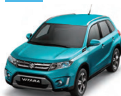
Azul Turquesa Perlado Metalizado (ZQN)