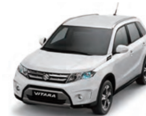
Blanco Superior (26U)