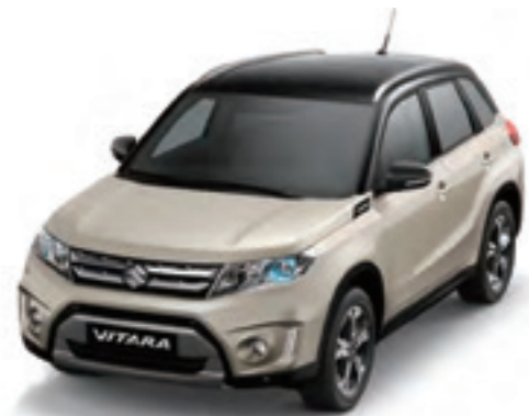
Marfil Sabana Metalizado / Negro Cósmico Perlado Metalizado (A9N)