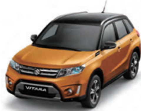
Naranja Atardecer Metalizado / Negro Cósmico Perlado Metalizado (A9M)