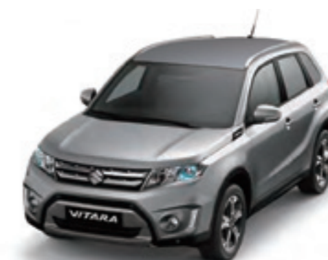
Gris Galáctico Metalizado (ZCD)