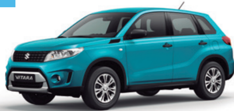
Azul Turquesa Perlado Metalizado (ZQN)