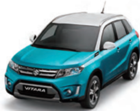
Azul Turquesa Perlado Metalizado / Blanco Superior (A6H)