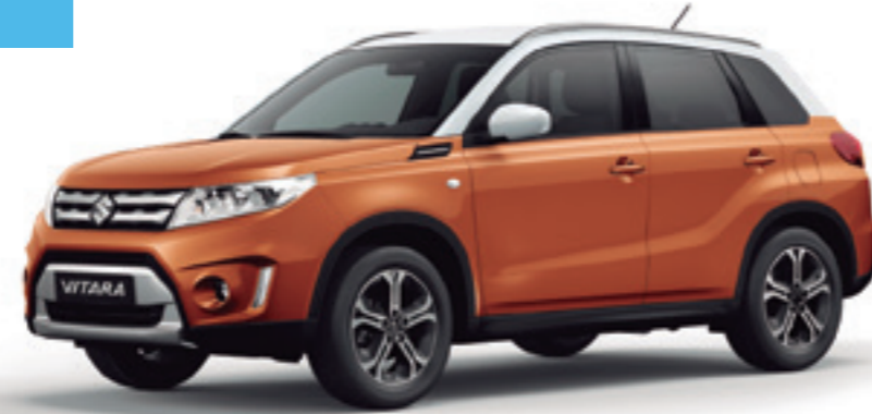
Naranja Atardecer Metalizado / Blanco Superior (A6J)