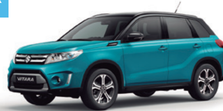
Azul Turquesa Perlado Metalizado / Negro Cósmico Perlado Metalizado (A9L)