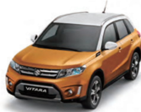
Naranja Atardecer Metalizado / Blanco Superior (A6I)