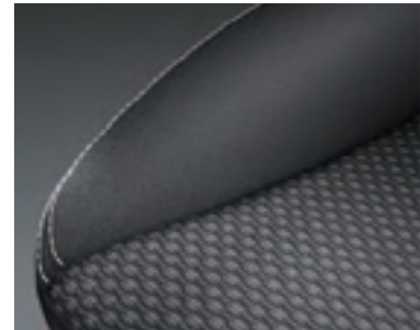
Tela con bordado