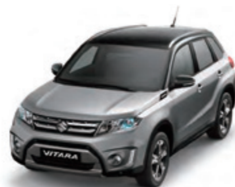
Gris Galáctico Metalizado / Negro Cósmico Perlado Metalizado (A9G)