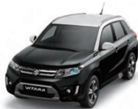
Negro Cósmico Perlado Metalizado / Blanco Superior (A6B)