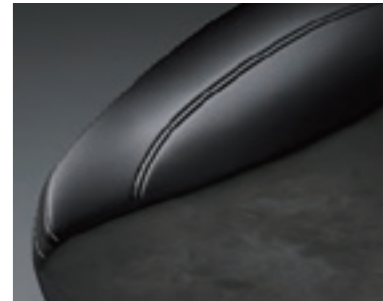
Mixta (tejido especial con inserciones en cuero)