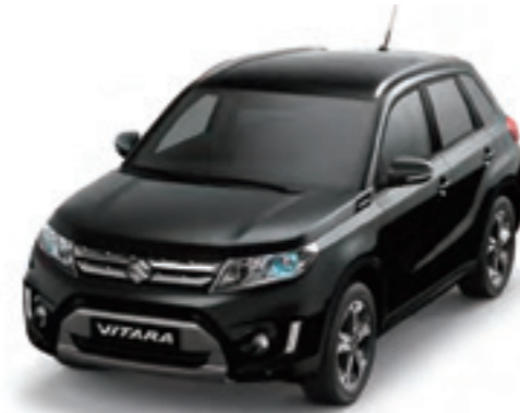
Negro Cósmico Perlado Metalizado (ZCE)