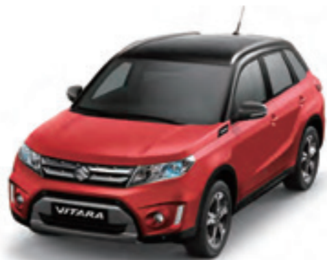
Rojo Bright 5 / Negro Cósmico Perlado Metalizado (A9H)