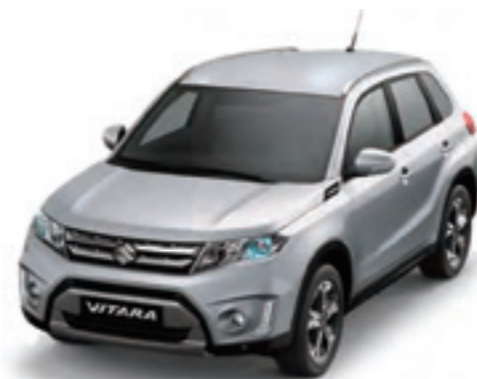
Plata Seda Metalizado 2 (ZCC)